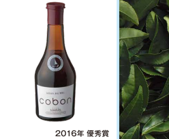
2016年 優秀賞 コーポナーベル N525