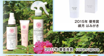
2017年 審査員賞 rosalrugosa

問い合わせ ジャパンメイド・ビューティ アワード実行委員会 (インフォーマ マーケッツ ジャパン株式会社内)