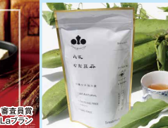
2019年 審査員賞 美食パン GaLaブラン