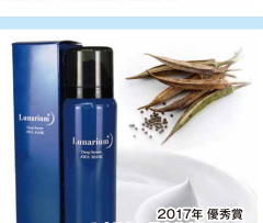
2017年 優秀賞 ルガリウム 濃密美容泡マスク