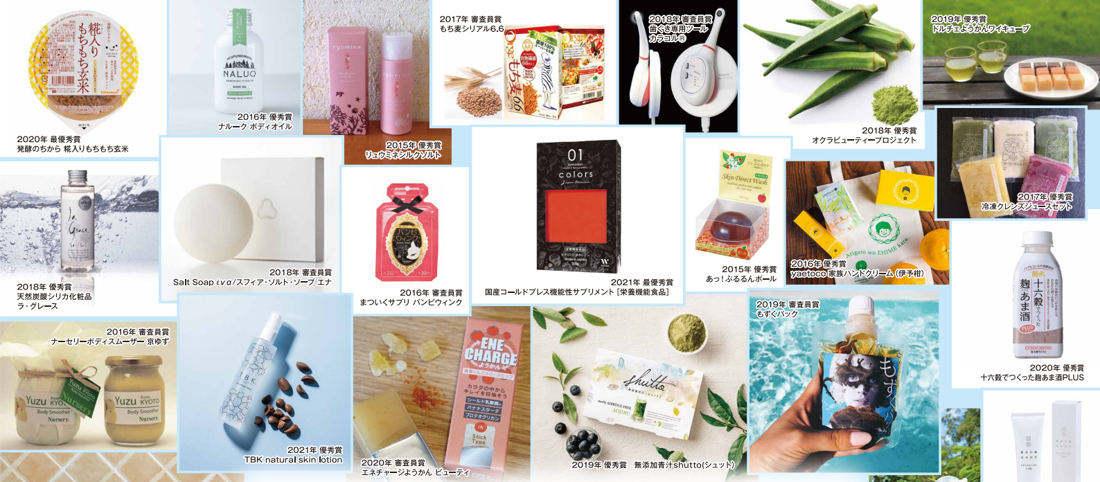
2020年 最優秀賞 発酵のちから 瓶入りもちもち玄米