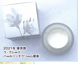
2021年 優秀賞 ラ・グレース パールリッチクリーム優美