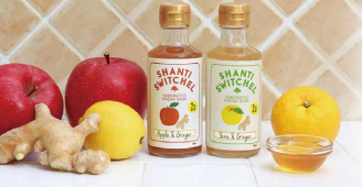
2017年 優秀賞 シャンティ スウィッチェル