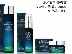
2018年 優秀賞 LaVie Précieuse A.P.G.Line