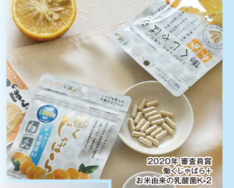
2020年 審査員賞 備久しよばらち お米由来の乳酸菌K-2