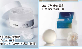
2017年 審査員賞 白美の幸 洗顔石鹸