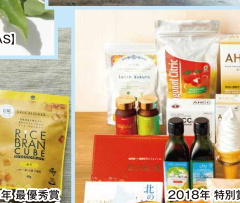
2016年 優秀賞 丹波なた豆茶 Small Pack 【有機JAS】