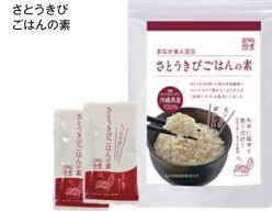
2016年 特別賞 さとうきび こはんの素