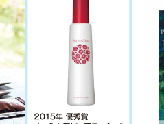
2015年 優秀賞 オールケアビューアローション 橋なののサラ