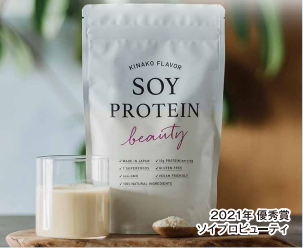
2021年 優秀賞 ソイプロビューティ