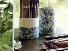
2019年 審査員賞 MeDu<肌潤>