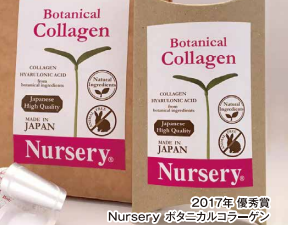
2017年 優秀賞 Nursery ボタニカルコラーゲン